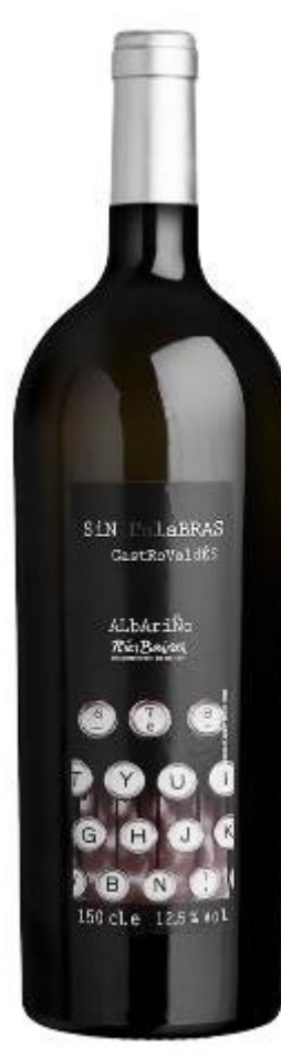
Sinpalabras castrovaldés 2018