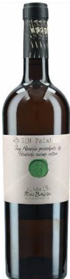
Sinpalabras Raspón 2018