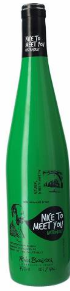
Nicetomeetyou Asturias 2017