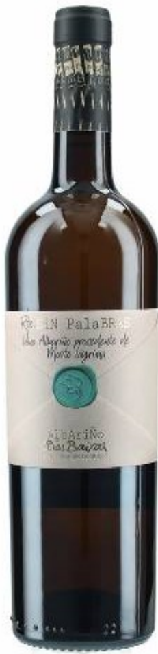
Sinpalabras Mosto flor 2018