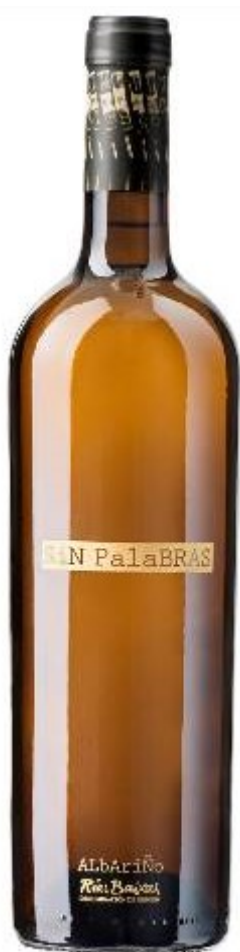
Sinpalabras Especial 2013